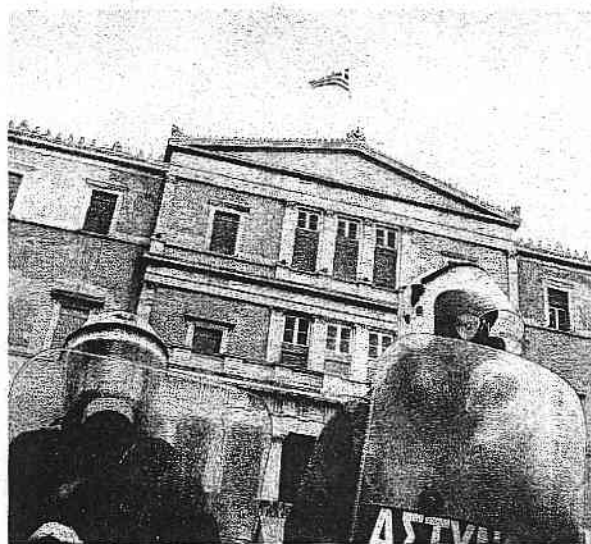
DIMOSTRAZIONI DI PIAZZA IN GRECIA CONTRO LE MISURE DI AUSTERITÀ IMPOSTE DALL'EUROPA

Il numero delle possibili vie d'uscita risulta, in questa situazione, piuttosto limitato. Il modo più semplice per liquidare i debiti, così come i nostri risparmi, resta sempre l'inflazione. Ma si possono sempre prendere in considerazione anche degli aumenti alle imposte, i tagli alle